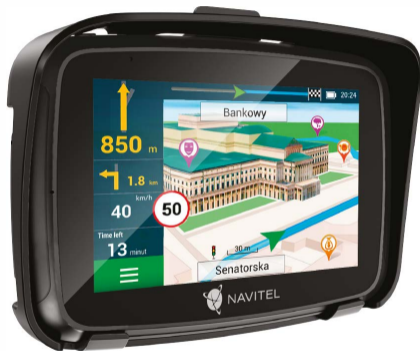
Prijenosni navigacijski uređaj NAVITEL G590 MOTO